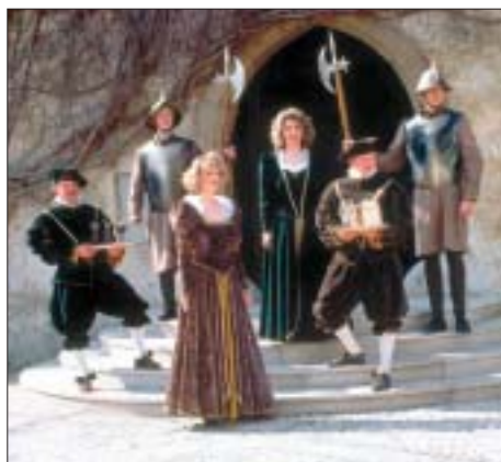
Pri grajski poroki mladoporočenca in svate pred vhodom v grad pričakata grof in grofica s spremstvom.

Pozorno pa bomo prisluhnili tudi vašim željam. Lahko vam pripravimo poročno koračnico v živo, fotografiranje, po-