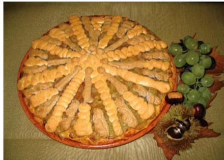
Grozdna pogača, ki jo pripravljajo v Termah Šmarješke Toplice.