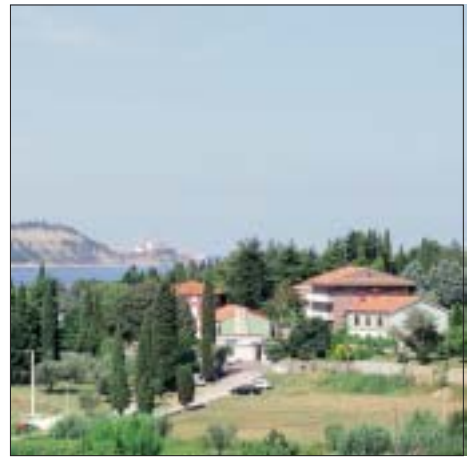
Hotel Laguna, novo pridobitev Zdravilišča Strunjan, sestavljajo tri dependanse.