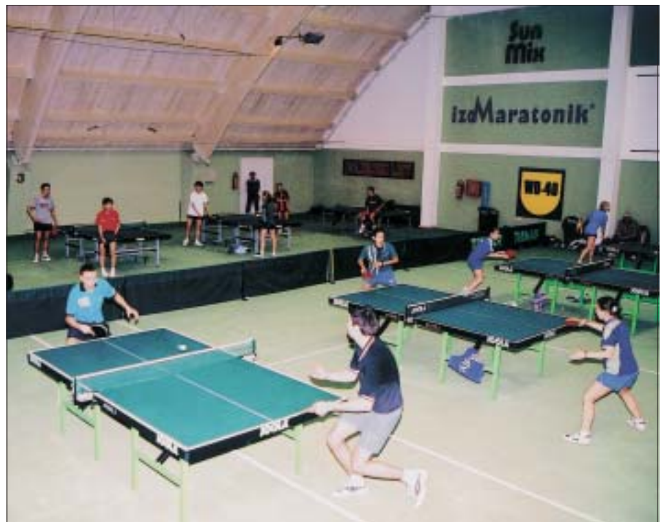
Najboljši mladi evropski igralci namiznega tenisa trenirajo v dvorani Teniškega centra na Otočcu.