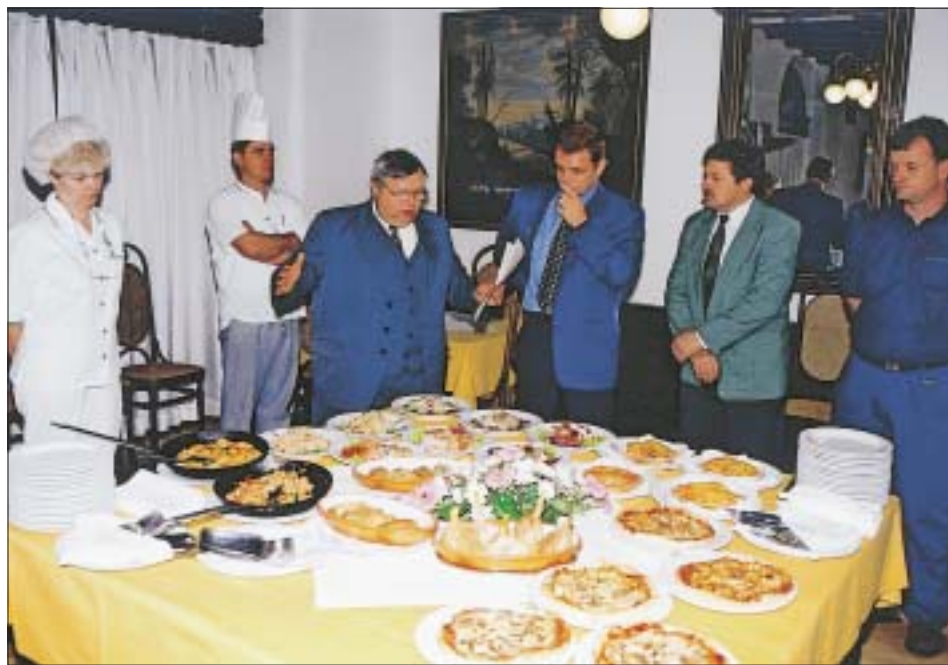
Za Wellness center Balneo so v Zdravilišču Dolenjske Toplice pripravili tudi poseben kulinarčni program. Izbira je bogata in pestra, poudarek je na lahkih in zelenjavnih jedeh ter raznih solatah. Pred otvoritvijo so pripravili celotno ponudbo, na tej predstavitvi je nastal tudi ta posnetek.

vstop v Balneo in uporaba storitev wellness centra elektronsko nadzorovana. Vsak obiskovalec ob prihodu dobi elektronsko zapeljnico, ki mu omogoča uporabo garderobne omarice, vstop v vsak sklop v Balnei in uporabo celotne ponudbe, vključno s konzumacijo hrane in pijače. Zapeljnica vse to beleži, ob izhodu pa gost poravnava račun.