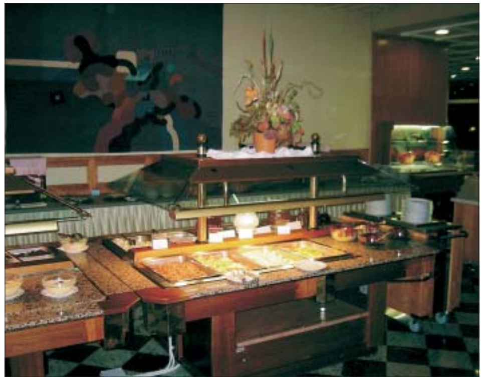
Pred kratkim smo v Strunjanu prešli na samopostrežni način nujenja vseh obrokov, kar so gostje dobro sprejeli, saj ima to veliko prednosti.

Ob uvedbi novega načina postrežbe smo ukinili stalne mize v času bivanja gostov pri nas. Tako si gostje sami izbirajo najprimernejšo mizo, se usedejo za mizo skupaj s prijatelji ali sami ob okno.