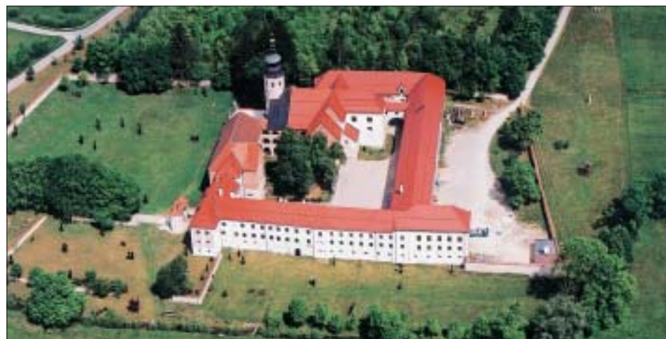
Pogled iz zraka na nekdanji cistercijski samostan v Kostanjevici, v katerem je sedaj Galerija Božidar Jakac. Mogočni samostanski kompleks, ki je bil med vojno požgan, že več desetletij obnavljajo.

Tako je bilo včasih. Letos Kostanjevica slavi 725-letnico. Nekdaj se je to majhno, a nadvse lepo in prijetno mesto imenovalo "tolažba dežele", danes pa je znano kot kulturno središče, katerega glas gre po vsem svetu. (Konec)