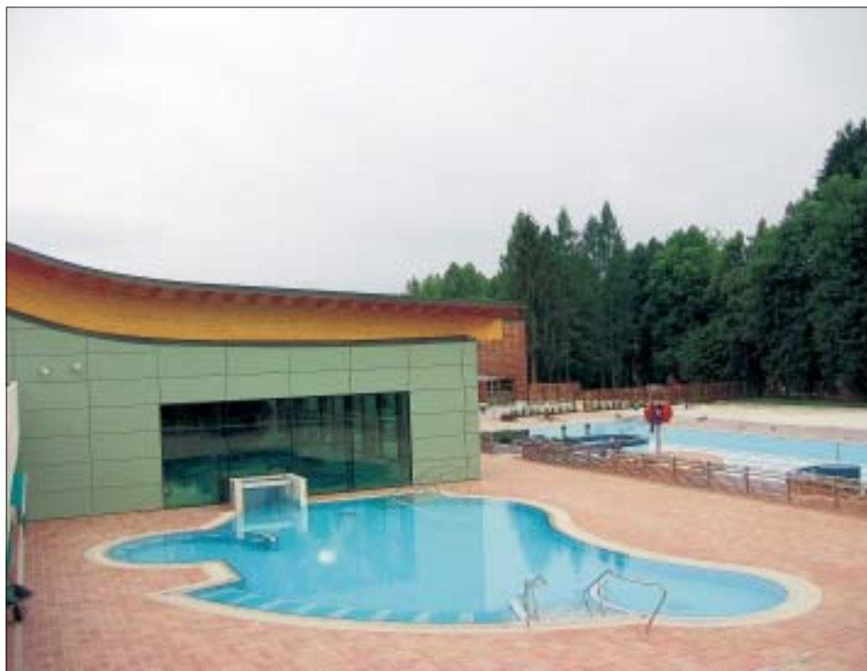
Podoba novega Wellness centra Balnea v Dolenjskih Toplicah pred otvoritvijo.

Balnea, v kateri bo delalo 20 ljudi, bo gotovo v Dolenjske Toplice privabila še več gostov, in ti bodo imeli kaj videti in doživeti. "Z Balneo smo v Slovenijo vpegljali wellness," je zadovoljen direktor Krevs.